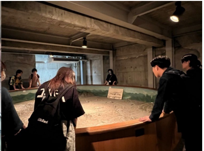
基町での視察風景 7/7