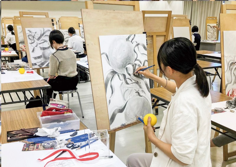
エ デザイン工芸学科